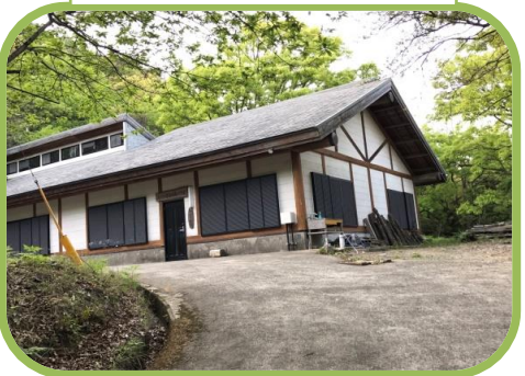
奥へ進むと木工館です