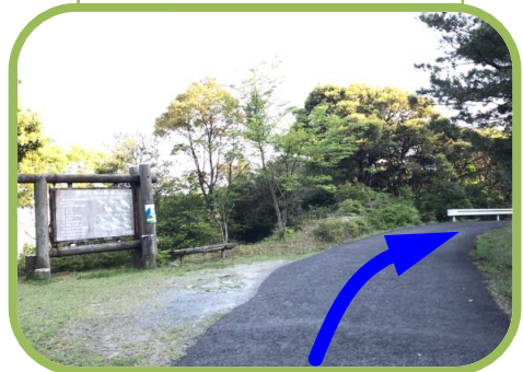
②道なりに進みます